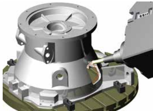
Mittels Pfadsimulation spürt der Anwender ohne kostenintensive Maschinen-Vollsimulation mögliche Kollisionen auf.